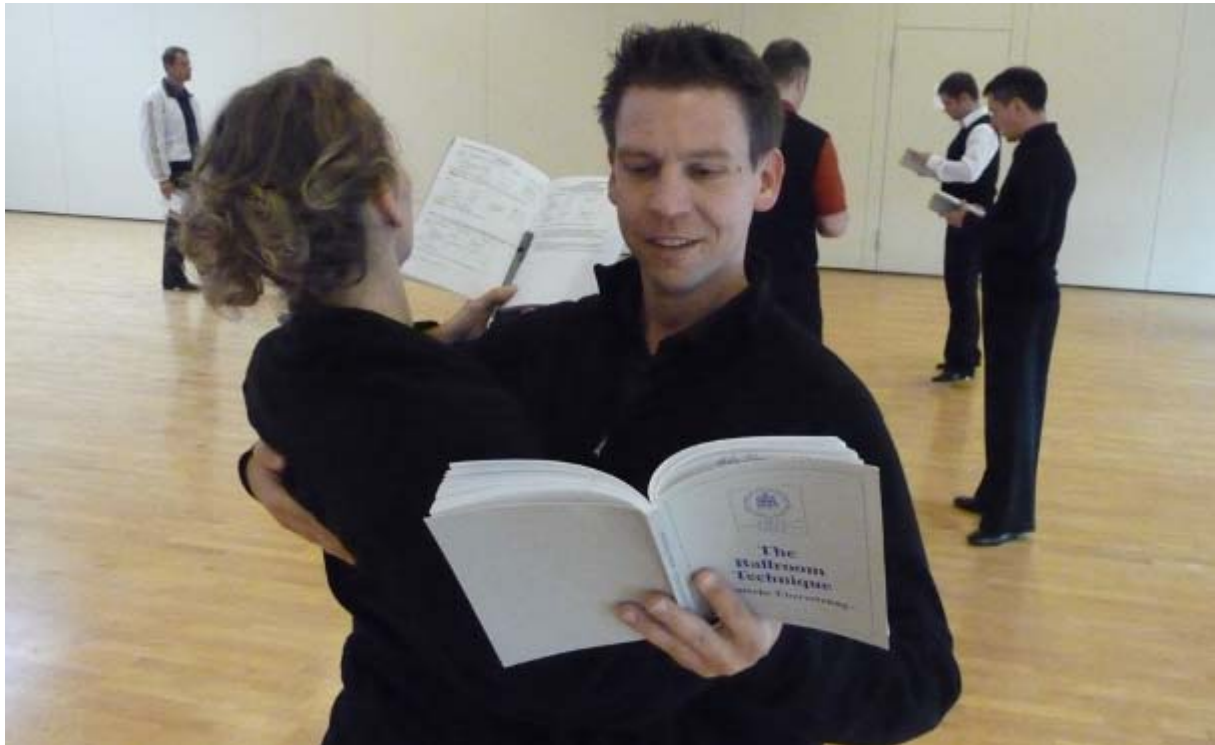
Tanzen streng nach Charts: Technik lernen in allen Haltungsvariationen beim C Standard-Lehrgang